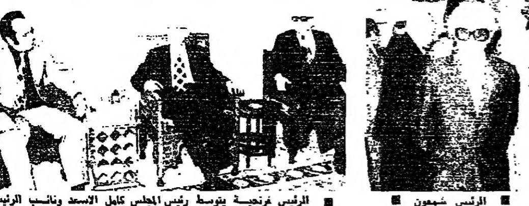
الرئيس سمعون، الرئيس فرنجية يتوسط رئيس المجلس كامل الاسعد ونائب الرئيس حتى ابو غانبل

سبب: في اننا نلتمس في الازمة الخريفية بعض الرضا عند القيادات الاقتصادية، واعطى مواضع مالا على ضرورة التطوير في التوازي الاقتصادية كتحريم التوسر السياسي بالحد من ازمة المرفأ التي تحول دون قيام صناعة صحية وتجارة مكننة.